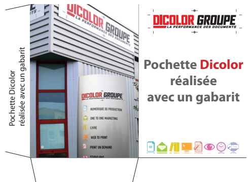
fichier gabarit « rempli »