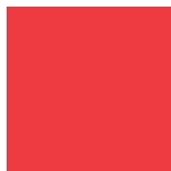
Pantone 185 C

N'utilisez jamais de couleurs Pantones. Elles ne sont pas adaptées à l'impression numérique et ne sont pas toujours reproductibles en quadrichromie.